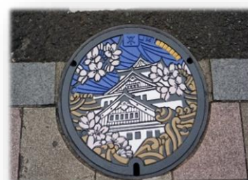
実際のマンホール