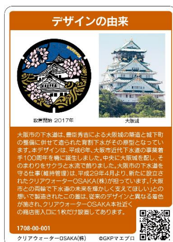
マンホールカード裏面