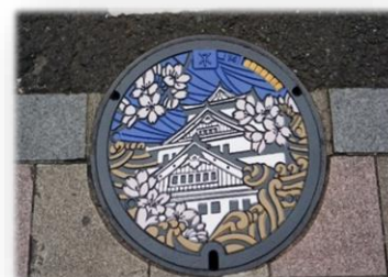
実際のマンホール