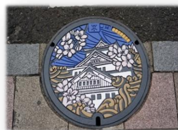
実際のマンホール