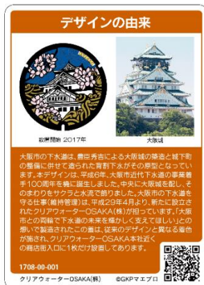
マンホールカード裏面