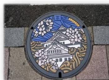
実際のマンホール